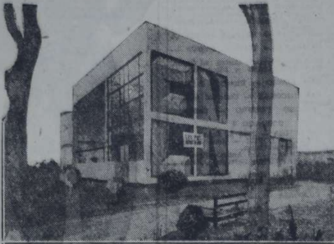
"Le pavillon de l'esprit nouveau" (ca sa pabellón del nuevo espíritu), presentado en la misma exposición; constituye un atrevido ejemplo de alojamiento tipo, siguiendo los principios modernos de standardización (inv. Le Corbusier y Jeanneret)

A esos recursos prácticos, al alcance de los arquitectos nacionales, hay que agregar, en la medida de sus conocimientos técnicos y artísticos, una contribución necesaria y, si cabe, desinteresada, en el planeamiento de las pequeñas viviendas económicas, hoy por hoy libradas a la capacidad de contratistas de menor cuantía. Si aspiran aquellos a embellecer el aspecto de nuestras ciudades, si se consideran capacitados para cooperar decididamente al desarrollo de la urbe y al preconizan, su necesaria ingerencia en la dilucidación de los problemas estéticos de carácter edilicio, bueno es que comprendan también todo el alto significado de una mediación efectiva en la ejecución de planes adecuados para tales residencias humildes, planes a proporcionar liberalmente y que podrían obtenerse mediante un concurso, facilitándoles luego a los pequeños propietarios que los requiriesen. Semejante colaboración no puede ni debe regirse por las mismas normas establecidas en los aranceles gremiales, debiendo aplicarse a ellas un concepto parecido al de la asistencia hospitalaria de los enfermos sin recursos. Justo es, pues, que se estudie la posibilidad y la conveniencia de que todos los arquitectos presten su contribución desinteresada a semejante pro-